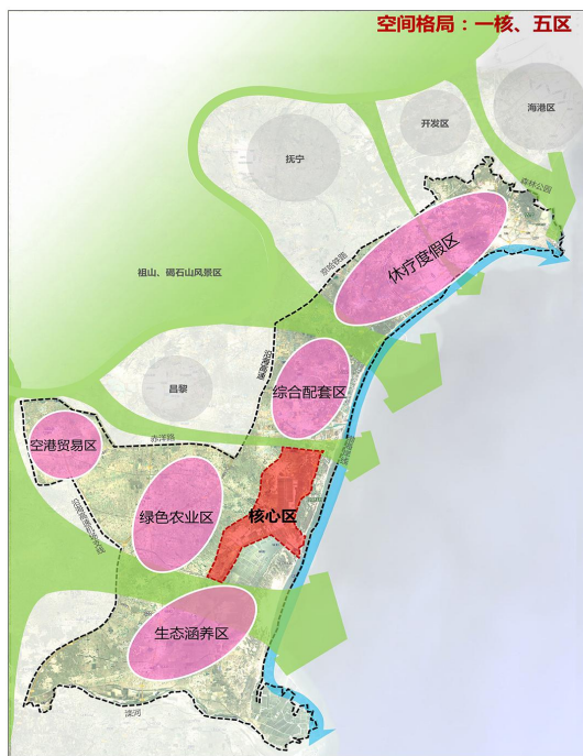
北戴河生命健康产业创新示范区规划范围图