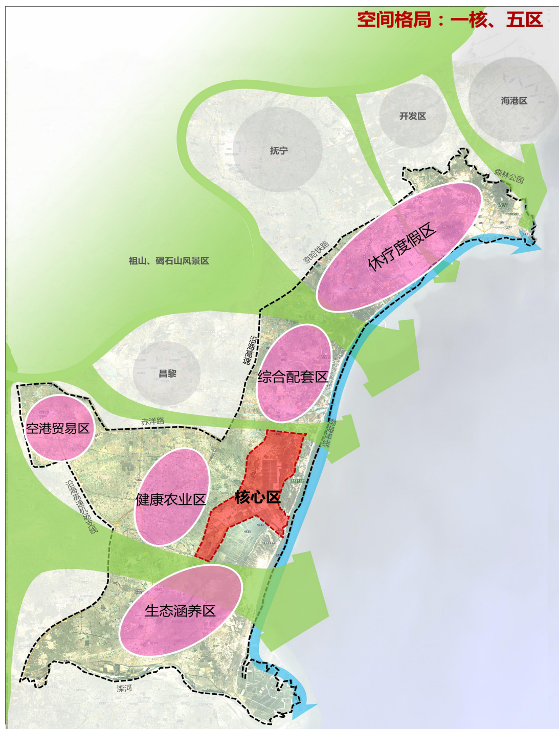
北戴河生命健康产业创新示范区总体布局示意图