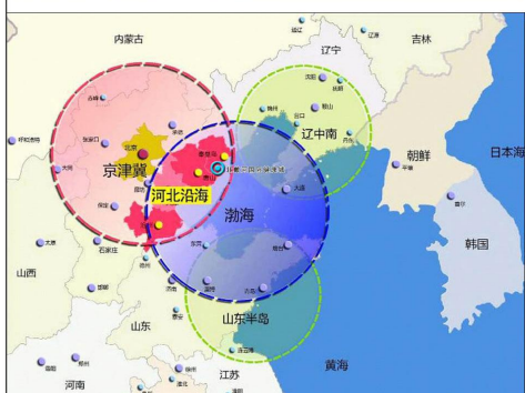
北戴河生命健康产业创新示范区在环渤海地区的位置